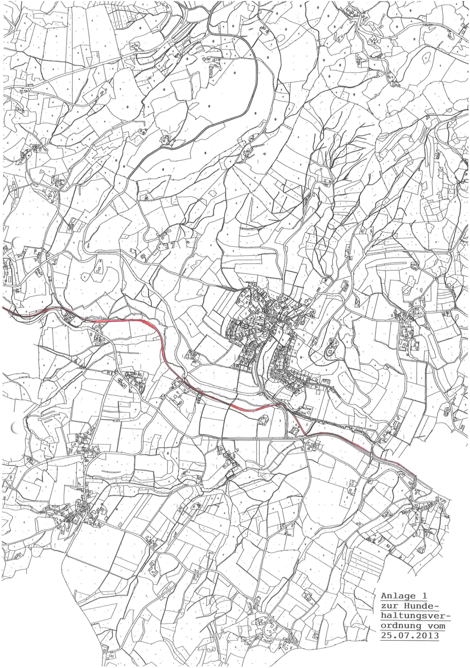
Anlage 1 zur Hunde- haltungsver- ordnung vom 25.07.2013